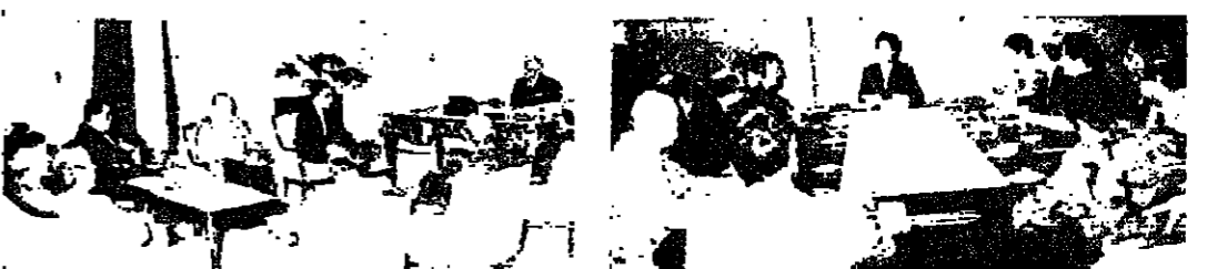
اللجنة مع الرئيس الجميل ■ ومع الرئيس كرايم ■ (اليمين واليسار)

زارت لجنة المتابعة المتابعة عن العمل لمعالجة الوضع الاقتصادي والتهديد لليرة اللبنانية في ظل الوضع الاقتصادي السيئ والتهديد بالانهيار المالي للبلاد. ولا سيما أنها ارتفعت سعر الدولار، والسعر الأعلى في الحد من ارتفاعه.